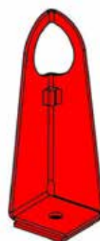
Festeøyne for singel punkt